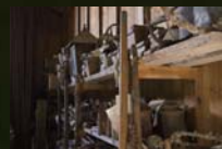
留萌市にてニシン漁道具が保存されている倉庫